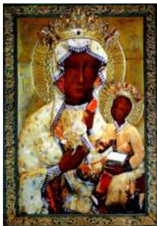
Sukienka Bursztynowo-Brylantowa z 2005r., zwana też sukienką zawierzenia Totus Tuus

Całość jest wykonana na konstrukcji srebrnej, wyłożonej bursztynem, jak również jest okuta złotem. Jako motywu zdobniczego użyto wyobrażenia lilii andegaweńskich, przyozdobionych brylantami, których malarskie wyobrażenie znajduje się również na Obrazie Jasnogórskim. Szaty Madonny i Jezusa mają lamówki z patynowanego srebra. Na wysokości szyi umieszczony został napis „Totus Tuus”. W dłoni Maryja trzyma bursztynową różę. Poświęcenia bursztynowej sukni dokonał abp Stanisław Dziwisz, metropolita krakowski 26 sierpnia, podczas uroczystości Matki Bożej Jasnogórskiej.