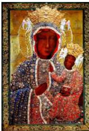
Sukienka Rubinowa z XVII w. zwana także Wierności

Pierwsze cztery wykonał br. Klemens Tomaszewski, hafciarz jasnogórski w XVII wieku. Zostały one szczegółowo opisane w inwentarzu skarbcza z 1685r. i nazywane były sukienkami: Imienia Jezus, Pelikana, Ducha Św. oraz Imienia Marii. Wkrótce przyjęły się nazwy od najbardziej charakterystycznych ozdób: Diamentowa, Perłowa, Rubinowa i Łańcuszkowa i tak nazywane są do dziś. Były wielokrotnie przerabiane i uzupełniane, m.in. przez br. Makarego Szyftowskiego, jednak do dziś zachowały się dwie z nich: Diamentowa, zwana też Brylantową (zakładana na największe uroczystości i święta kościelne) i Rubinowa (zakładana w Adwencie i Wielkim Poście). Obie używane były do ozdabiania Cudownego Obrazu do sierpnia 2005 roku.