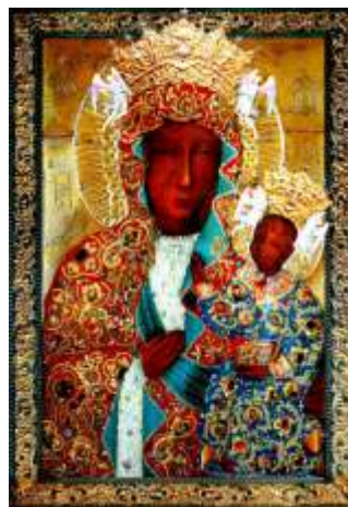
Sukienka Sześćsetlecia z 1982r., zwana też złotą

Konstrukcja ze srebrnej repusowanej blachy została obciągnięta czerwonym i niebieskim aksamitem, części sukni pokryto przyczepiając perełki, natomiast na wywiniętych częściach fałd mafioreonu haft w kolorze błękitu. Płaszcz Maryi i Dzieciątka pokrywa haft wici roślinnej z licznymi szlachetnymi i półszlachetnymi kamieniami. Na tej sukni są umieszczone największe półszlachetne kamienie, są m.in. kolczyki, sygnety, spinki, brosze, wisiorki, na których to wyrobach złotniczych widzieć można brylanty, perły, rubiny, turkusy, szmaragdy, granaty, opale i topazy, często zestawione w rozety. Dzieciątka trzyma w ręku książkę, na której grzbiecie jest wygrawerowany napis: „W 600-lecie obecności obrazu Bogarodzicy na Jasnej Górze ufundowano staraniem OO. Paulinów za generała Józefa Płatka i przeora Konstancjusza Kunza”. Znajduje się w Skarbcu Jasnogórskim.