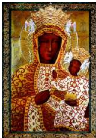
Sukienka Koralowa z 1910 r.

Obrazu Matki Bożej, kobiety z ziemi kieleckiej ufundowały sukienkę koralową. Nie przypomniała ona tej utraconej, ale historia XVII-wiecznej perłowej sukienki jeszcze będzie miała swój ciąg dalszy.