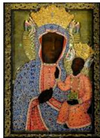
Suknia perłowa z 2018r.