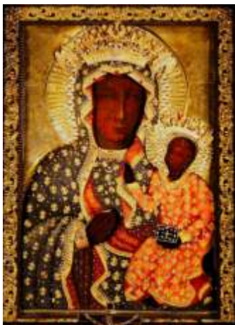
Sukienka Milenijna z 1965 r., zwana też Sukienką Tysiąclecia

Kolejne dwie sukienki wykonały Siostry Westiarki z Warszawy. Pierwsza znicz, chyba najbardziej znana, ufundowana została w związku z uroczystościami Millenium - Tysiąclecia Chrztu Polski (966-1966)