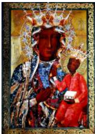
Sukienka Wdzięczności z 2010 r

Kolejna, wykonana również przez gdańskiego złotnika to wotum narodu złożone z darów składanych przez pielgrzymów, rodziny i wspólnoty z kraju i zagranicy. To sukienka wdzięczności i miłości, cierpienia i nadziei narodu polskiego z 2010 r. ufundowana z okazji 100-lecia koronacji Cudownego Obrazu.