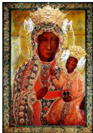
Sukienka Koralowa z 1969 r. zwana też koralowo-perłowo -bizuteryjną

Repusowana blacha została obciągnięta aksamitem niebieskim i czerwonym, na którym zostały umocowane perły, korale, emaliowane brosze, krzyżyki i łańcuszki.