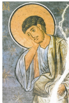
Św. Jan Apostoł

Surowy prorok znad Jordanu jest stróżem krótkich, kuszących nocy i strzeże siana na pokosach przed powodzią. W wielu okolicach Polski panuje wśród ludu przekonanie, że nie należy kąpać się w rzece lub jeziorze przed dniem św. Jana."